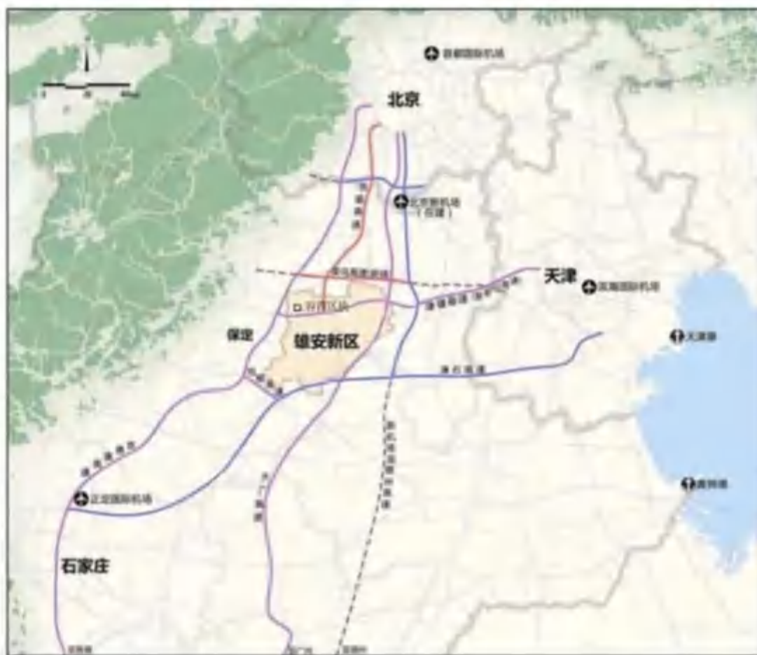
图2 交通位置示意图

京市约 108km，东距天津市约 100km，交通便利（见交通位置示意图 2）。