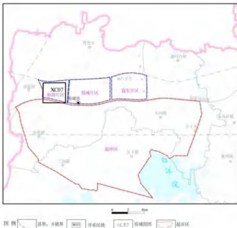
图1 评估范围示意图